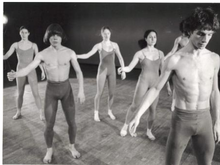
La compagnie Bagouet dans Ribatz, Ribatz ! en 1976

Le 14 octobre à l'auditorium de Quimper Le 16 novembre au Sterenn, MJC de de Trégunc