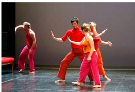
Matière première, 2002