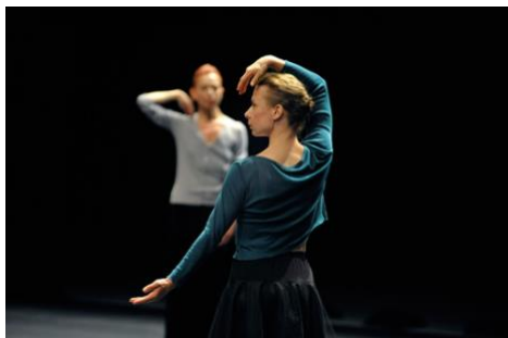
Si je meurs, laissez le balcon ouvert

Montpellier – Montpellier Danse à l'Agora, cité internationale de la danse Du 3 au 9 décembre 2012 à l'initiative de Jean-Paul Montanari